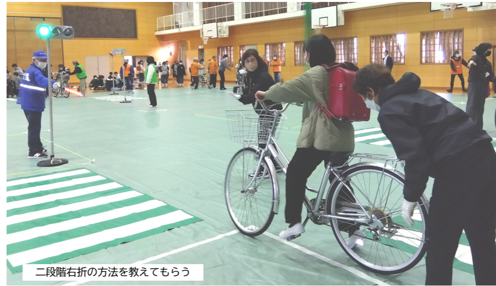
二段階右折の方法を教えてください

東郷・南郷小学校の6年生142人が、2月6日、中央中学校体育館で行われた「自転車交通安全教室」に参加しました。