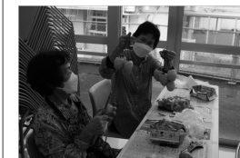
健康オリンピック講座 「干し柿作り」