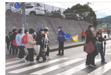
青少年指導員と地域の方と中学校まで徒歩で移動

題字 蓮本香扇 発行元 南郷地区コミュニティ運営協議会/広報委員会 宗像市野坂2119-5 TEL: 0940 (36) 3465 FAX: 0940 (34) 8049 発行責任者 釜瀬博志