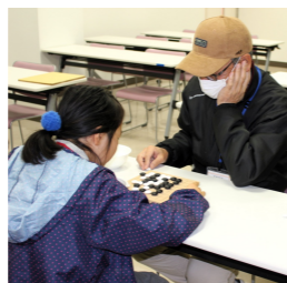
あそこに打って次あそこに打って