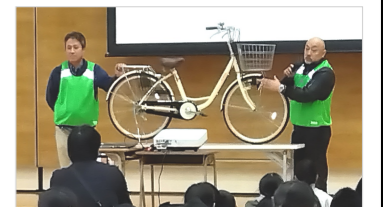
1か月に1回は、タイヤの空気を入れよう

〈参加児童の声〉 ★実際に乗って、アドバイスをもらえたり、分かりやすかったです。 ★あまり自転車に乗ったことが無かったので、いい体験になりました。 ★自転車は、練習や設備点検をすることが大切だと思った。 ★クイズなどがあって分かりやすかったです。 ★自転車の長持ちする方法を知れて良かったです。 ★自転車に久しぶりに乗ると、あまりバランスがとれなくて、意外と難しいことが分かりました。