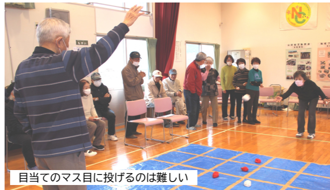
目当てのマス目に投げるのは難しい

「福祉教育について知ろう」をテーマに、福祉講演会を2月15日に行いました。健康福祉部会員と福祉協力員19人が参加し、社会福祉協議会の上野さんより、宗像市で行われている福祉教育の取り組みや視覚障害について話を聞きました。その後、南郷小4年生が体験している「アイマスク・ガイド体験」をしました。2人1組がペアになり、1人は全盲体験用のアイマスクを着け、もう1人が介助をしながら、狭い道や階段などを歩きました。皆さん、階段を下りるのが怖かったそうです。 周りの情報を伝えることが大切や人によって伝え方が違い、伝わり方も違うこと、どのように声をかけたら良いのか、考える機会になりました。