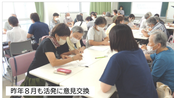
昨年8月も活発に意見交換

今回は、3月22日(金)14:00~15:30、南郷コミセン2階ホールで行います。テーマは、「通いの場を続けていくためのアイデアについて」です。皆さんの参加を待っています。