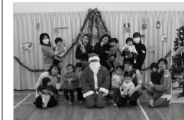
親子教室「南郷キッズ」