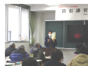
詐欺対策3ヶ条 ・理解しましょう ・疑いましょう ・落ち着きましょう

「福祉教育について知ろう」をテーマに、福祉講演会を2月15日に行いました。健康福祉部会員と福祉協力員19人が参加し、社会福祉協議会の上野さんより、宗像市で行われている福祉教育の取り組みや視覚障害について話を聞きました。その後、南郷小4年生が体験している「アイマスク・ガイド体験」をしました。2人1組がペアになり、1人は全盲体験用のアイマスクを着け、もう1人が介助をしながら、狭い道や階段などを歩きました。皆さん、階段を下りるのが怖かったそうです。 周りの情報を伝えることが大切や人によって伝え方が違い、伝わり方も違うこと、どのように声をかけたら良いのか、考える機会になりました。