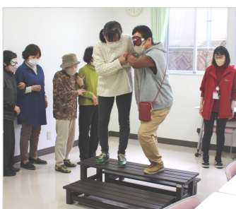
ゆっくり上りましょうね

★「全部楽しかった」と娘も言っていました。皆さかかげで親子共々楽しめました。 ★家で試してみようと思えます。 ★ほとんどの作業が子どもとできてとても良かったです。 ★簡単なできたのはビックリ！ ★参加者の声へ ★実際に乗って、アドバイスをもらえたり、分かりやすかったです。 ★あまり自転車に乗ったことが無かったので、いい体験になりました。 ★自転車は、練習や設備点検をすることが大切だと思った。 ★クイズなどがあって分かりやすかったです。 ★自転車の長持ちする方法を知れて良かったです。 ★自転車に久しぶりに乗ると、あまりバランスがとれなくて、意外と難しいことが分かりました。