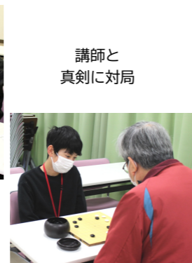
講師と真剣に対局

地元有志3人が指導する囲碁教室が2月11日に行われ、5人の小中学生が参加しました。