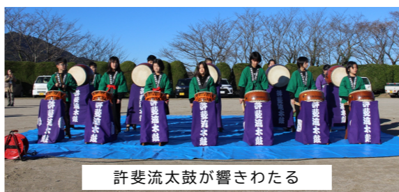
許斐流太鼓が響きわたる