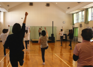
ダンスの後は筋トレ

「かるた」の劇遊びをしました。その後、紙皿でコマを作った回したり、「もちつきごっこ」をしたり、親子で楽しい時間を過ごしました。