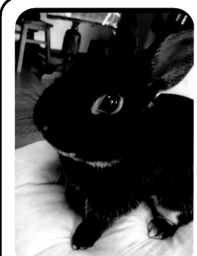
しょうすけ(しょうちゃん) 10才 オス ネザーランドワーフ