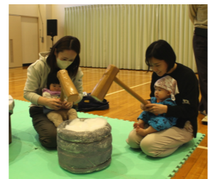
おもちをパツタン

「かるた」の劇遊びをしました。その後、紙皿でコマを作った回したり、「もちつきごっこ」をしたり、親子で楽しい時間を過ごしました。