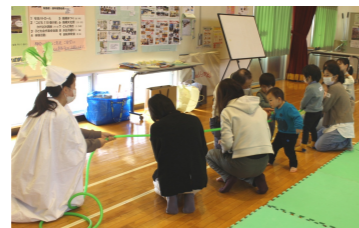
大きなカブがぬけました