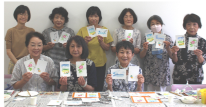
暑中見舞い 申し上げます

はがき絵「松師古の心だより」の講座を7月4日に行いました。優しい色合いの絵を描くコツを教えるも、夏のお便りが完成しました。