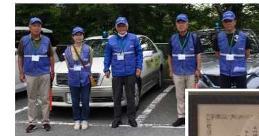
↓感謝状いただきました

今回の受賞はコミセンの支援はもとより、地域住民のパトロール活動に対する理解・応援あってのご褒美だと感謝しています。