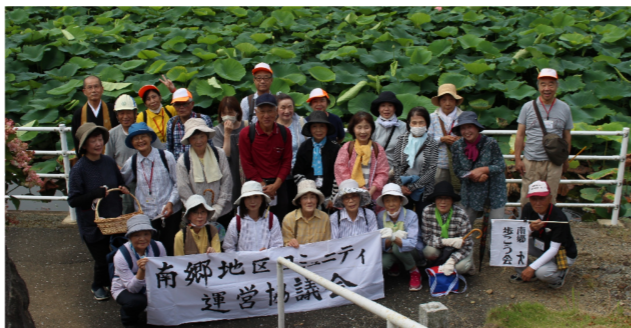
蓮池をバックに(西福寺)

少し蒸し暑い梅雨曇りの中、参加者24人で6月24日に野坂花めぐりコースを歩きました。熱中症対策のため、約4kmのコースになりましたが、西福寺の蓮、通称、増水通りの立葵、そして種類も色も様々なたくさんの紫陽花に癒される花めぐりでした。貴重な蓮のお話を聞かせてくださった西福寺のご住職、休憩所やご支援をいただきましたみなさま、本当にありがとうございました。