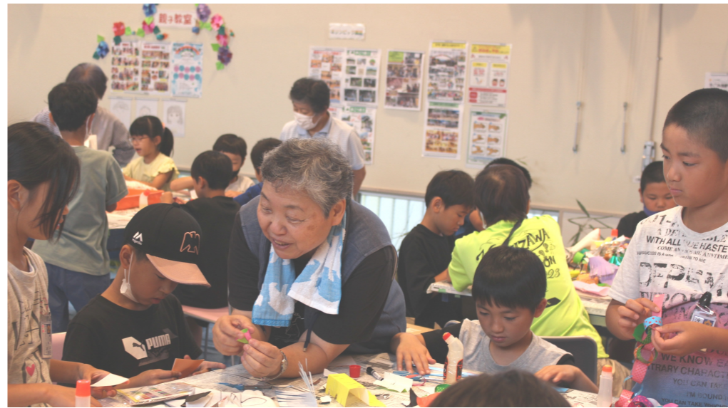
みんなで作ると楽しいね

健康福祉部会では、南郷小学校3年生と一緒に、7月7日に南郷コミセン多目的ホールで七夕交流会を開催しました。