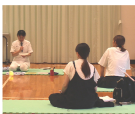
プラス思考に集中

託児つきの講座を、6月29日に行いました。今回は4人が参加し「呼吸法と瞑想」を体験。参加者は「呼吸を意識して、ゆっくりした時間を過ごさせてリフレッシュになりました」と感想を聞かせてくれました。