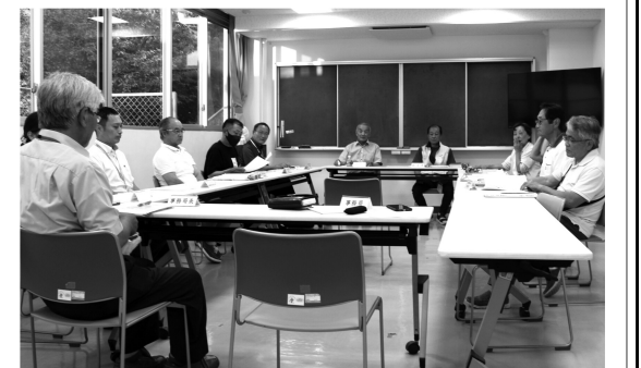
より良い南郷地区を目指して！

南郷コミュニティ役員会は、役員10人、事務局員1人、市職員2人で構成、毎月一回開催されています。検討事項は、南郷地区全般的にかかわる問題や、コミセン運営にかかわる問題、各部会の活動報告計画など、多岐にわたります。役員さんには必ず発言を求め、様々な意見の中「全会一致、または賛成多数」で決定しています。 (各区の要望などは、改善提案書にて) 役員の方皆さんいつも本当にお疲れさまです。