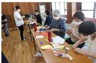
野坂カフェ 七タブくり