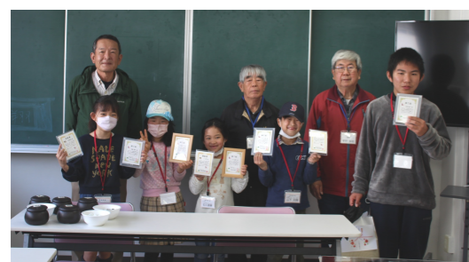
修了式に笑顔で参加

今年度修了式が3月12日にありました。一生懸命に囲碁を打つ姿は素晴らしいと感じました。これからも続けてほしいと思います。