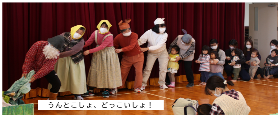
うんとこしょ、どっこいしょ!