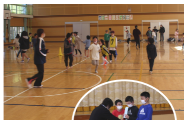
6年生よく頑張りました

火曜日の放課後に、宿題を頑張り、体育館で思いっきり遊ぶ「火曜アンビ」の修了式を3月14日に行いました。今年度は24回の開催で、登録児童66人のうち、毎回9割近くの子どもたちが元気に出席してくれました。困っている時に優しく声をかけてくれた上級生に、いつもあなたがたかく見守っていたボランティアの皆さんに、楽しく1年間頑張れた自分に、感謝の気持ちがある修了式でした。