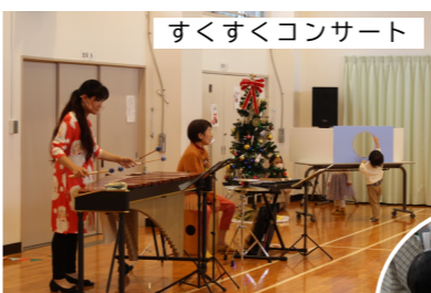
パン生地こねこね→