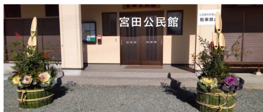
門松の中にある3本の竹、笑ったように見えませんか！

アンビシャス広場の体験塾でも子どもたちやコミセンのしめ縄作り教室でも教えてくれました。今も、みなさんに教えることが楽しみだそうです。