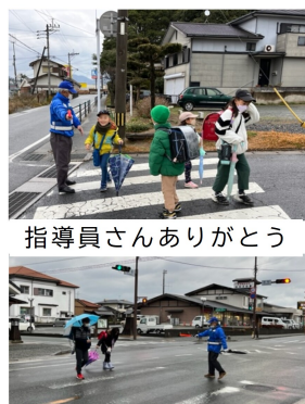
指導員さんありがとう

員のあいさつに元氣よく応えていました。指導員さん、雨の中ご苦労様でした。指導員12人は、安全・安心な南郷地区を目標に頑張っています。これからも地域のみなさまのご支援をよろしく願います。