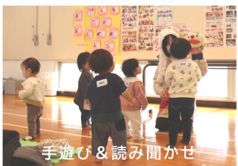
手遊び&読み聞かせ