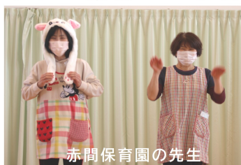
赤間保育園の先生