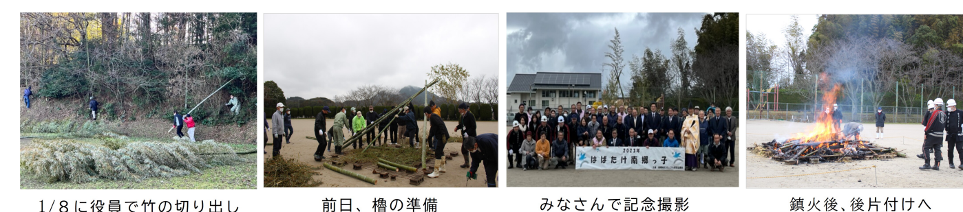
1/8に役員で竹の切り出し