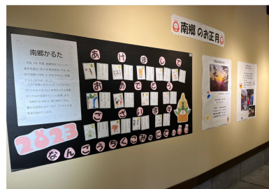
事務局作成の「南郷のお正月」赤馬館に展示中、2/1～2/26赤間駅にて展示されます。

員のあいさつに元氣よく応えていました。指導員さん、雨の中ご苦労様でした。指導員12人は、安全・安心な南郷地区を目標に頑張っています。これからも地域のみなさまのご支援をよろしく願います。