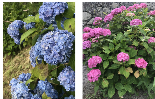
写真は令和2年、3年に大穂で撮影

南郷歩こう会 生きがいづくり推進委員会 生きがいづくり推進委員会による「歩こう会・宗生寺花まつりコース」が、5月8日に行われました。令和元年以来、三年ぶりの開催となり、南郷地区内外から総勢32人が参加しました。当日は熱すぎるくらいの日