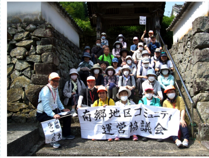
三年ぶりの「記念撮影」に笑顔満開