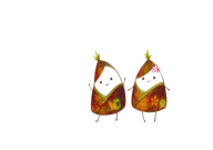
採れたてのタケノコ

地域づくり部会では、4月28日、29日にタケノコの収穫と塩漬けを行いました。大きく育ったタケノコをカットして茹でました。その後、樽にビニール袋を敷き、タケノコと塩を入れて密封し、重しを載せて蓋をして保冷庫に保管しました。今年度は樽8個分のタケノコの塩漬けを使用し、メンマの製造から販売まで一連の作業を行います。メンマ開発は、竹林の問題など様々な観点から注目されています。