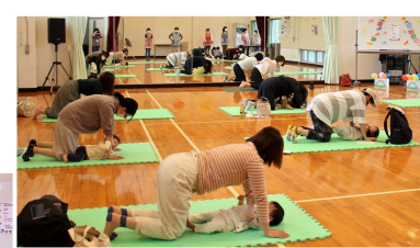
絵本の読み聞かせ「きんぎょがにげた」

その後、ボランティアによる絵本の読み聞かせやこいのぼり作りの工作を楽しみました。