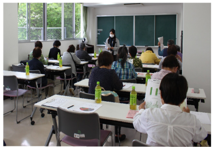
地域の見守り活動を頑張ります

5月10日に各区の福祉協力員と健康福祉部会員の役員が見守る中、新任4人の方に委嘱状を渡されました。その後、宗像市社会福祉協議会より福祉協力員活動の概要を聞きました。