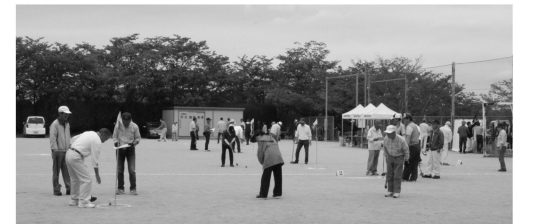
3年前のグラウンドゴルフ大会の様子

公民館活動部会は、「地域の親睦・融和の更なる前進を目指した公民館活動」を目標とし、いろいろな事業を計画しています。スタートは、5月22日に三年ぶりに開催される南郷地区公民館対抗親善交流グラウンドゴルフ大会を行い、初めての試みとして12月4日に、南郷地区囲碁大会を東郷地区と合同で開催することとしました。これも楽しみです。 令和3年度に、自由活動への挑戦としてパラリンピックで話題になった「ポッチャ大会」を計画しましたが、コロナ禍で中止となりました。今年こそ新事業に挑戦していきます。 各事業の開催内容につきましては、コミュニティだより「もやい」にて募集しますので、みなさん参加してください。