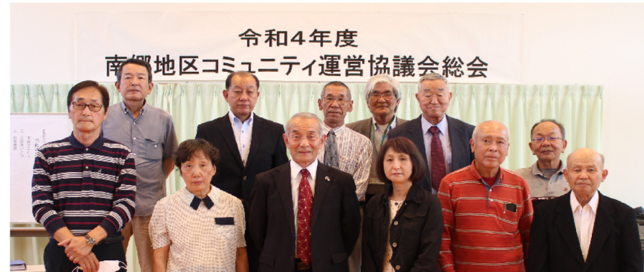
令和4年度 南郷地区コミュニティ運営協議会総会