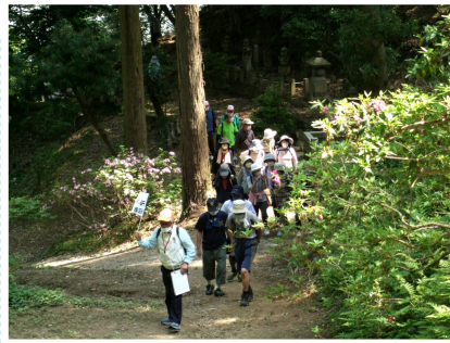
解説を聞きながら、次の馬頭観音へ