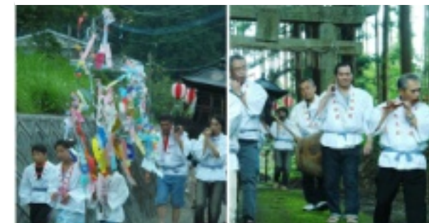
須賀神社祇園祭(王丸)

南郷地区に古くから伝わる祇園祭が今も原町区と王丸区に残っています。原町の総鎮守の原神社の祇園祭7月10日に、王丸の須賀神社の祇園祭7月14日に行われました。