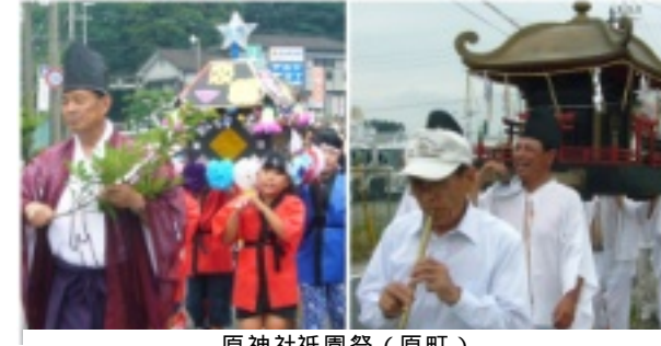
原神社祇園祭(原町)