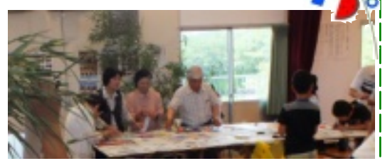
短冊に願いをこめて

7月7日に南郷小学校の3年生・仲良し学級・単身高齢者と健康福祉部会員が参加して、南郷コミュニティセンター(食会)楽しく食べて話そう(会)がありました。 児童たちがお年寄りに、歌や踊りを披露し、皆で七夕飾りを作り、健康福祉部会員が作ったカレーを食べました。 出来上がった七夕飾りは、南郷小学校、南郷コミュニティセンター、JA南郷支店、かのこの里、南郷郵便局に飾ってあります。