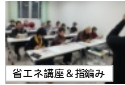
省エネ講座&指編み