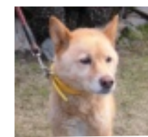
「チャトラ」 8オメス 柴犬