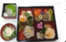
お弁当箱に豪華に盛り付け

新年に飾ったしめ飾りや古いお札などは、 1月9日のどんど焼き(会場:南郷運動広場)に お持ちください。詳細は裏面をご覧ください。 どんど焼き当日は、県道町川原赤間線の原町区内 で道路舗装工事による車両通行止めになります。 通行の際はご注意ください。(下記参照)