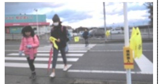
横断中は、 旗を使って車に知らせよう

南郷小学校児童が、設置された黄色の旗を使って横断している姿を見て、設置できて本当に良かったと思えました。ご協力いただいた関係者の皆様に心より感謝いたします。