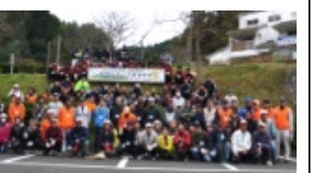
ありがとうございました 許斐山登山道・史跡整備事業に 参加して下さったボランティアの皆さん

許斐山登山道・史跡整備 ボランティア事業は、11月 29日に参加者150人で、怪 もなく無事に終了しました この事業は、豊かなふる さとづくりを目指し、実行 委員会が設立されました。 南郷地区コミュニティ、宗 像市、ボランティアの三位 一体の力が達成の基盤とな りました。