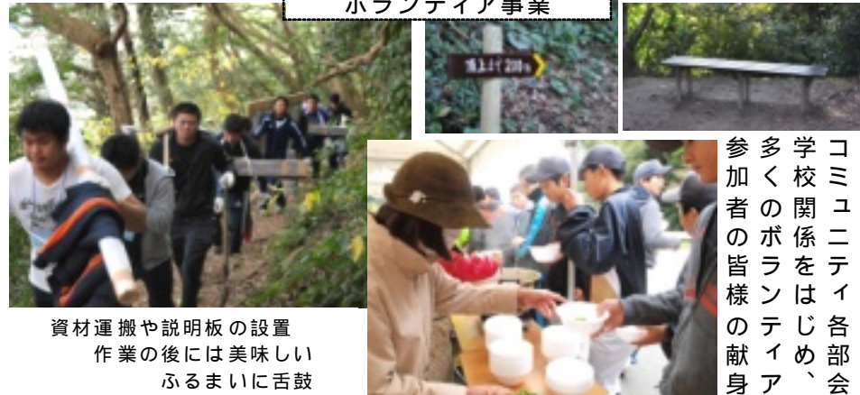
資材運搬や説明板の設置 作業の後には美味しい ふるまいに舌鼓

平成26年度に取り組みが 平成27年度は、現地踏査が 平成27年11月29日に多 整備作業を実施しました。 なり、許斐山も新年を迎え く整備作業を実施しました。 植物名板や案内板も新し く整備作業を実施しました。